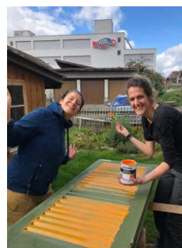
Der Vorstand im Einsatz für die Kita!